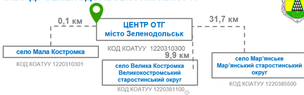
Рис.1 Склад Зеленодольської міської територіальної громади

Кількість домогосподарств та населення громади (всього та в розрізі населених пунктів), статева та вікова структура населення