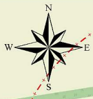
СХЕМА ТРАНСПОРТНОЇ МОБІЛЬНОСТІ ТА ІНФРАСТРУКТУРИ M1:10000